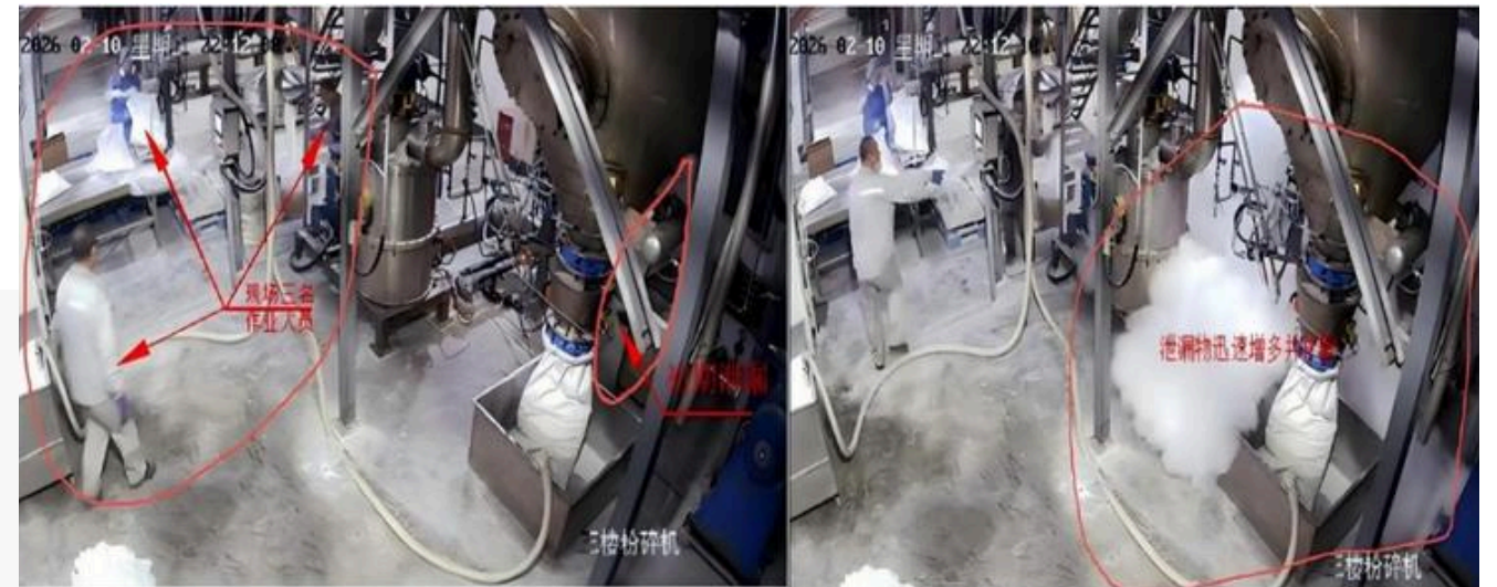
图一. 22时12分08秒换热器发生泄漏，现场三名作业人员

2026年2月10日22时12分许，在抚顺高新技术产业开发区双旗精细化工有限公司偶氮二异丁腈车间发生一起爆燃事故，事故造成2名包装工人重伤、1名工人轻伤，直接经济损失约279万元。经调查认定，该起事故是一起企业违规操作、安全设备维护保养不到位、安全管理责任未有效落实造成的生产安全责任事故。